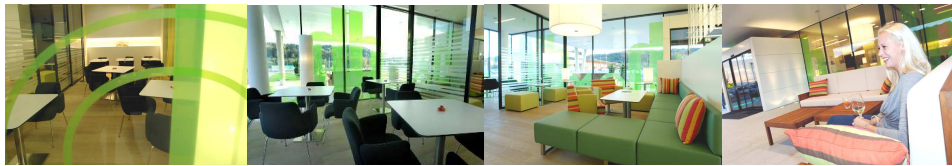
Lobby / Terrasse

Kitchenette mit Kühlschrank und Gefrierschrank, Mikrowelle, Wasserkocher, Kochplatte und Spülbecken Flatscreen mit Internet, E - mail Funktion und Infotainment ausgeklügelte Stauräume für Kleidung, Schuhe, Freizeitutensilien, Hobbygeräte reichlich Ablagemöglichkeiten im Arbeitsbereich und im Badezimmer Beleuchtung regulierbar auf Arbeitssituation und Wohnsituation optimaler Schallschutz zwischen den Einheiten, dem Gang und nach außen breiter Balkon mit Sitzecke