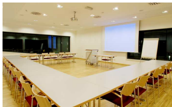
Sitzungsraum im Sportzentrum Hart