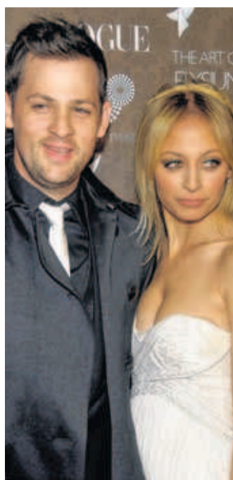
Nicole Richie mit Joel Madden.

BURBANK. Arnold Schwarzenegger steht Marihuana-Konsumententolerant gegenüber. „Es kümmert doch niemanden, ob du einen Joint rauchst oder nicht“, sagte der ehemalige Hollywoodstar in einer US-Talkshow. Schwarzenegger hatte vor fünf Wochen einem Gesetz zugestimmt, demzufolge der Besitz von kleinen Mengen Marihuana nicht schärfer geahndet wird als ein Verkehrsdelikt.