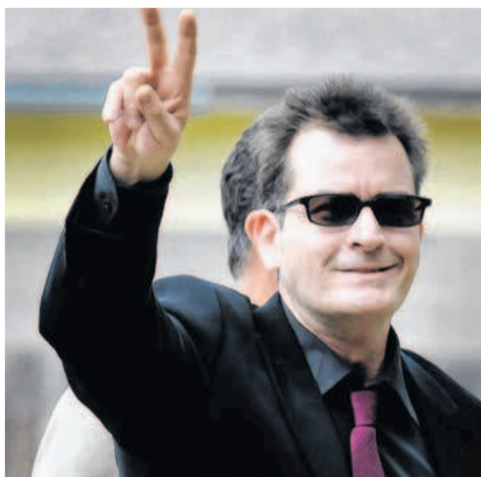
Charlie Sheen versteht die ganze Aufregung nicht. „Wenn ein Kerl mal eine schlechte Nacht hat, drehen alle gleich durch...“

LOS ANGELES. Charlie Sheen (45) versteht die ganze Aufregung und die Schlagzeilen der letzten Zeit nicht und kann sich nicht erklären, warum alle Welt sich so um ihn sorgt. Jetzt hat der Schauspieler sein Schweigen über das kuriose Ereignis in New York gebrochen, bei dem der skandalträchtige „Two and a Half Men“-Star in seiner Suite im „Plaza Hotel“ nackt und betrunken aufgegriffen wurde, nachdem er wutentbrannt in seinem Hotelzimmer randaliert hatte. Er hinterließ einen Schaden von 7000 Dollar.